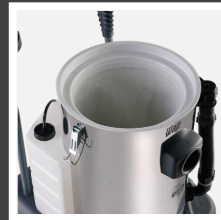
Recipiente de 20 L para água suja