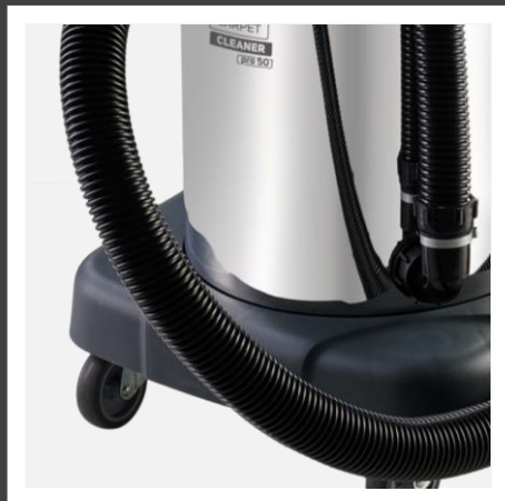
Mangueira flexível 2,5 metros