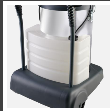
Recipiente de 10 L para água limpa