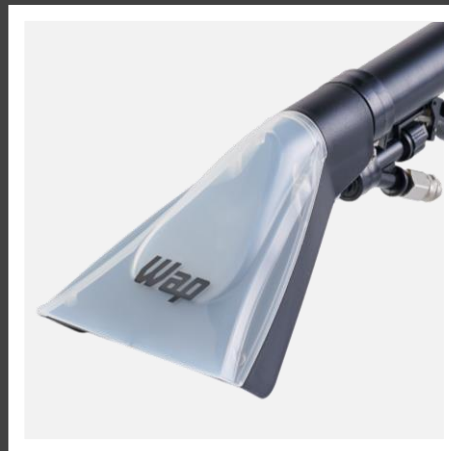
Bico pequeno para estofados