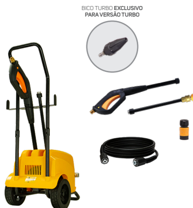
BICO TURBO EXCLUSIVO PARA VERSÃO TURBO