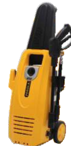
WAP PEROLA ABW-VP-70