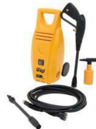
WAP MINI PLUS II e III ABW-VB-70